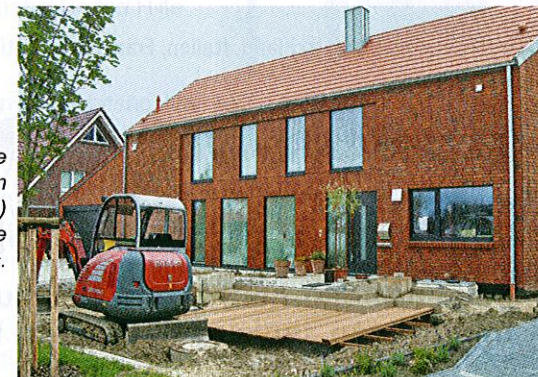
Besondere Architekturformen (hier: die Fassade) locken die Blicke des Betrachters.

ganz spezielle Art mit dazu beitragen, dass hier kein „monotones Einerlei“ an Neubauten entsteht, wie dies leider nur allzu oft in anderen Neubaugebieten der Fall ist.