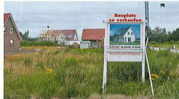
Auf mehreren Bauplätzen stehen noch die Schilder namhafter Haushersteller – bis jetzt ist mehr als die Hälfte aller Grundstücke verkauft.

Zwar stehen hier in naturnaher Umgebung rund 100 Bauplätze zur Verfügung, doch ist auch die Nachfrage, entsprechend der lukrativen Lage mit optimaler verkehrstechnischer Anbindung, sehr hoch.